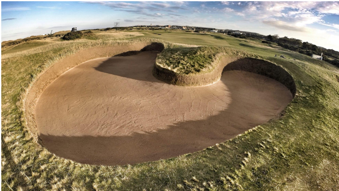
LE HELL BUNKER...

Le Old Course est réputé pour ses nombreux « bunkers » (bacs à sable), dont le fameux « Hell Bunker », devenu une icône du golf. Le parcours lui-même comporte des fairways vallonnés, un terrain naturel et des obstacles d'eau, ce qui le rend à la fois fascinant et stimulant pour les joueurs.